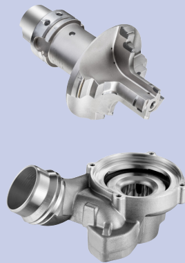
validation de géométrie d'outils & conditions de coupe