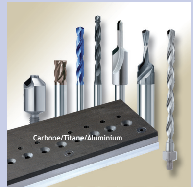
développement de géométries spécifiques pour l'usinage des nouveaux matériaux